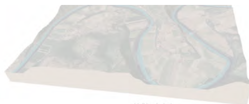
Vallée du Lot

Quelques questions viennent compléter ces enjeux ; elles permettent de vous exprimer librement sur les orientations et les projets d'aménagement à définir en lien avec la thématique concernée.