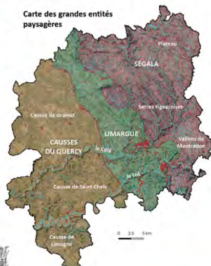
Carte des grandes entités paysagères