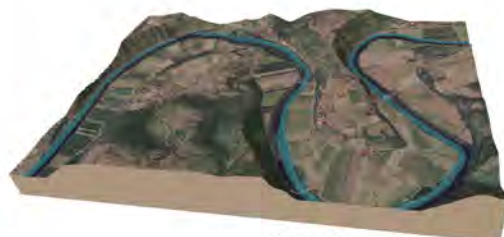
Vallée du Lot