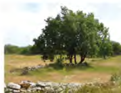
Paysage caussenard, Quissac