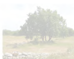
Paysage caussenard, Quissac