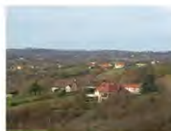
Exemple de mitage du paysage par de l'habitat individuel, Cardaillac